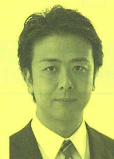
福岡市長 高島宗一郎