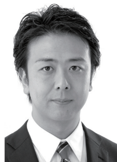
福岡市長 高島宗一郎

これまでのFUKUOKAゲームインターンシップの参加者が、期間中に体験したこと・学んだこと等を、参加者自らがブログ形式で報告しています。ぜひ一度ご確認ください。 ■FUKUOKAゲームインターンシップblog : http://www.gff.jp/internship/