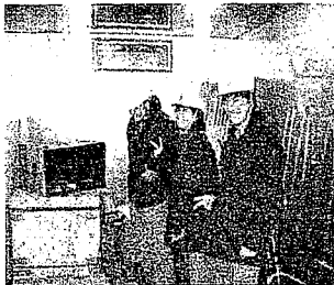
【研究・開発コース】の様子